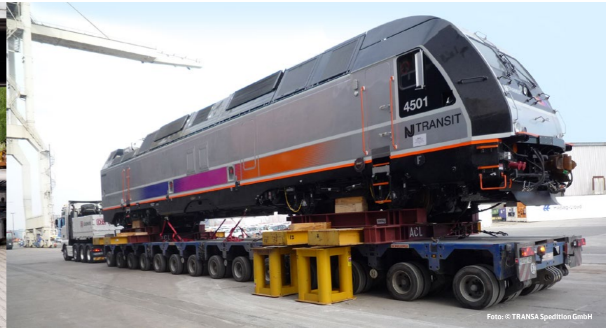
Die nordamerikanische Lok am Hamburger Hafen.